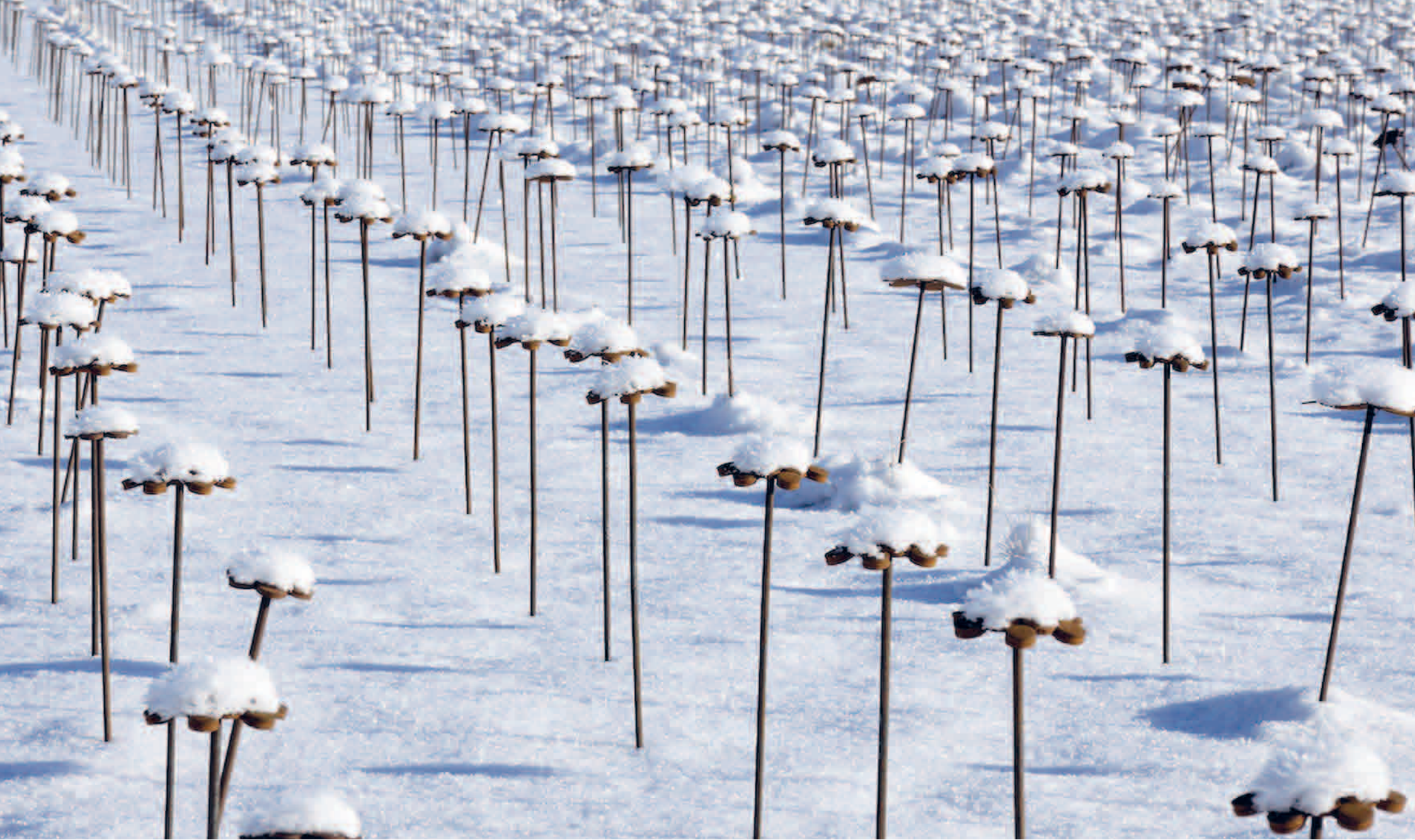
Coronablommor Geert van der Vossen Vallen i Bolum, vintern 2020