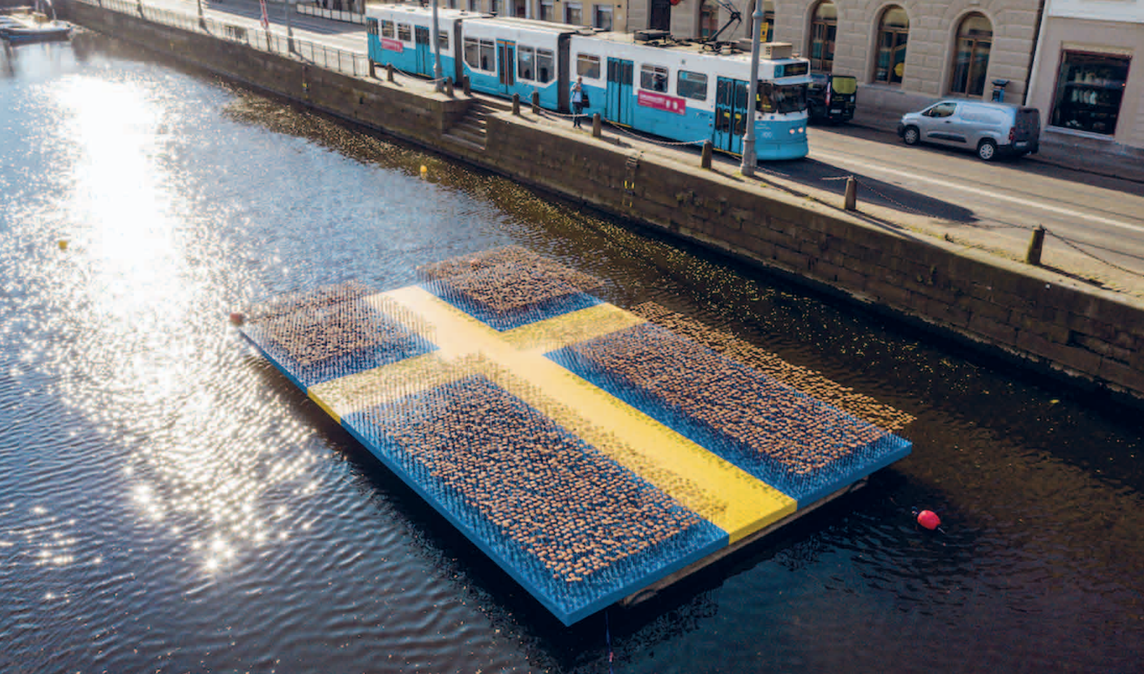
Coronablommor Geert van der Vossen Stora Hamnkanalen, Göteborg, 2021