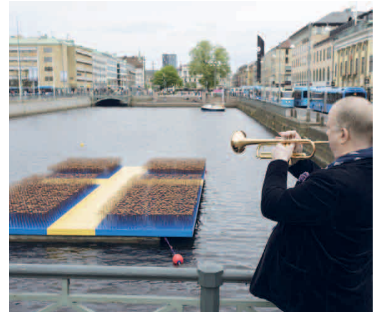
Coronablommor Geert van der Vossen Stora Hamnkanalen Göteborg, 2021