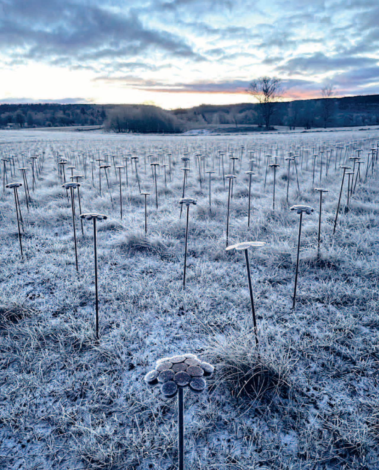
Coronablommor Geert van der Vossen Vallen i Bolum, vintern 2020