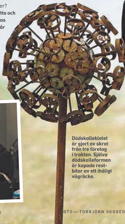
Dödskalleklotet är gjort av skrot från tre företag i trakten. Själva dödskalleformen är kapade restbitar av ett ihålligt vägräcke.

Bäst och jobbigast på jobbet: "Att leta skrot är som att titta ner i en godispåse, jättekul när man hittar en ny form. Om jag vet att ett företag har bra material som jag inte kan få så känns det som att någon slänger påsen i soptunnan."